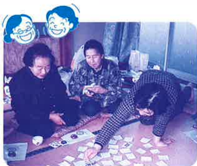
みんなで絵合せゲーム

地域のお年寄りが集落会館等を集いの場として、和気あいあいと一日をゆっくり楽しく過ごしていただく寄り合いです。また、仲間作りをしながらみんなが同じ立場で会費等を負担し、参加者みんなで運営し、楽しむ寄り合いです。新規実施地域には年間30,000円の活動費を交付します。