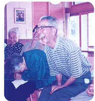
笑顔でレクリエーション