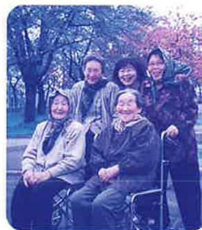
バスハイクでリフレッシュ