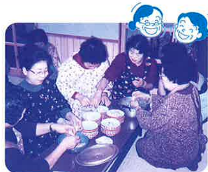
みんなで楽しく調理