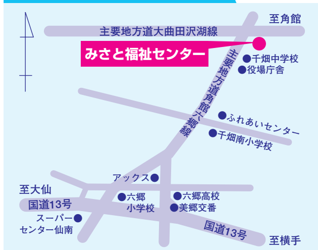
みさと福祉センター案内図